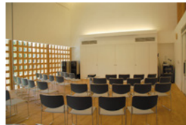
約80人収容の学習室(1F)