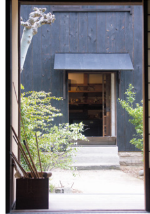
膨大な資料を収蔵していた書庫