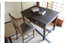
顕微鏡を覗きやすくするため傾斜がつけられた研究用の机