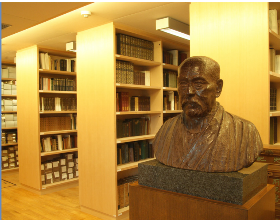
25,000点以上の資料を収めた収蔵庫(1F)

知られていないその人となりや先駆的な研究、さらにはエコロジストとしての南方熊楠の世界に触れてみてください。