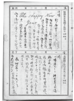
3. 明治18年日記(部分) 顕彰館蔵